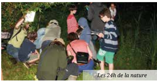
Les 24h de la nature