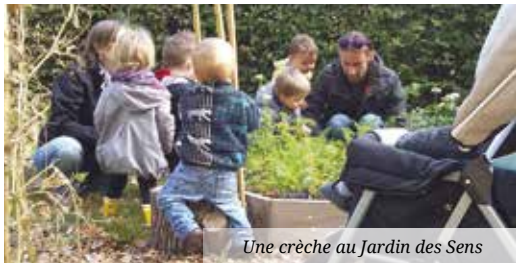
Une crèche au Jardin des Sens