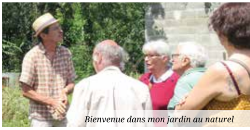
Bienvenue dans mon jardin au naturel